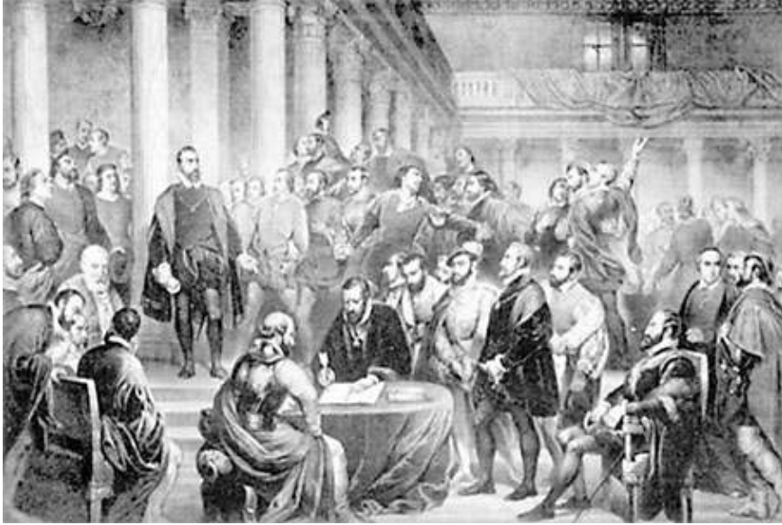
Amnestie voor langgestraften.