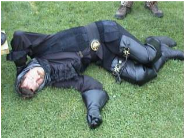
Een speelbal van de Fairies.

De transportonderneming DZR, die momenteel het monopolie bezit op het vervoer van goederen, wrijft zich in zijn handen. "Het belooft een goede cirkel te worden," zo verteld de eigenaar glunderend. "We komen handen te kort. Maar we mogen zeker niet klagen. We zijn de snelste en beste transporteur in de Far Kingdoms. Wat logisch is als je de enige bent met kennis van zaken," zo vertelt hij luid lachend.