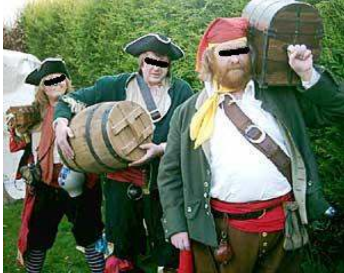
Een zuidelijk transport.

Na aandringen vertelde hij ons dat het ging om: "water bij de wijn doen, overvallen op zijn transporteurs, het verwisselen van kruiken etc. Maar zo snoefde hij: "wij hebben genoeg, terwijl zij slechts nog voorraad voor enkele maanden hebben. Zelfs al zou onze productie in zijn geheel uitvallen dan nog hebben wij ruim